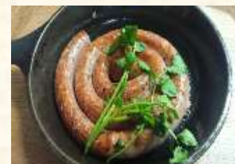
グルグルソーセージ