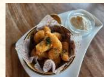
ポップコーンシュリンプ