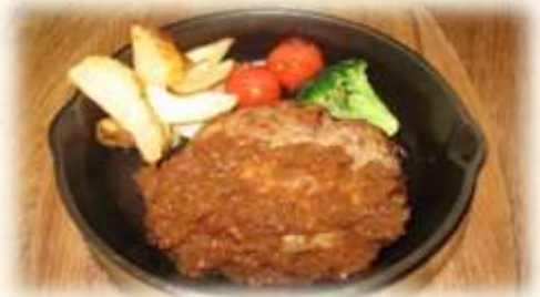
プレミアムハンバーグセット

ボリュームたっぷりのハンバーグ。 (ソースはシャリアピン・甘辛おろしソース ・デミグラスソースからお選びください。) (ライス白米 or パン・サラダ・スープ付き) (ライス大盛り +200円)