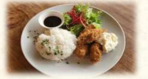
カキフライライス

黒酢ソース&タルタルソース添え カキフライをトッピングしたごはん。 (ライス大盛り 200円)