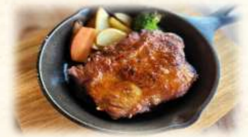
パリパリチキンセット

皮がパリパリのチキンです。 (ライス白米 or パン・サラダ・スープ付き) (ライス大盛り +200円)