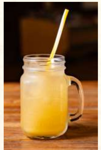
フレッシュマンゴー