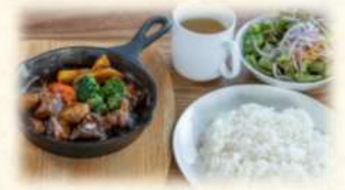
ビーフシチューセット

香ばしいビーフシチューです。 (ライス白米 or パン・サラダ・スープ付き) (ライス大盛り +200円)