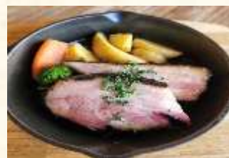
スモークベーコン