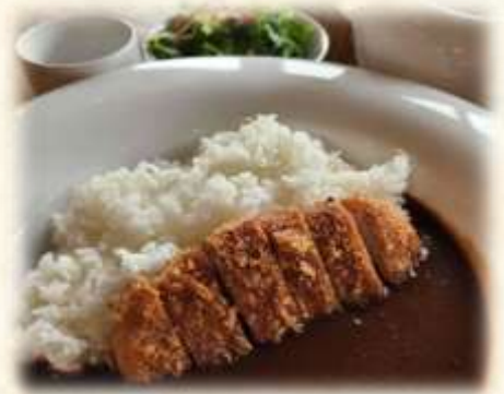
プレミアムカツカレー

カレーのルーには、自慢の「ふじやまビールのデュンケル」を入れ込んで時間を掛けて仕上げています。 さらに、ボリューム満点のポークカツをのせた特製カレー。 カツを揚げるため お時間を頂いております。 (ライス大盛り +200円)