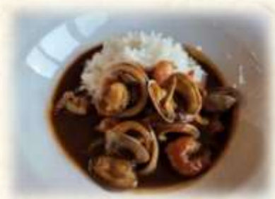
シーフードカレー