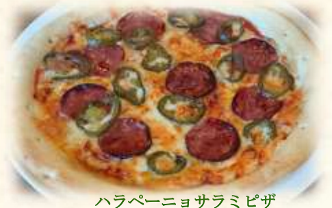
ハラペーニョサラミピザ