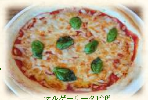
マルゲリータピザ

一枚一枚注文をいただいてから、やわらかい生地の上に たっぷりの具材とチーズをのせて焼き上げた特製ピザです。 オーブンで焼き上げたスキレット料理。 ※注文が入ってからオーブンで焼き上げるた お時間を頂いております。