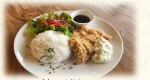
チキン南蛮ライス

黒酢ソース&タルタルソース添え 唐揚げをトッピングしたごはん。 (ライス大盛り 200円)