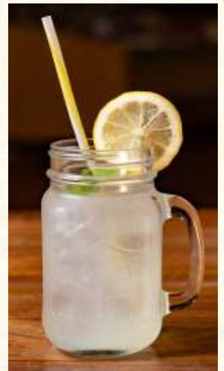
自家製レモネード